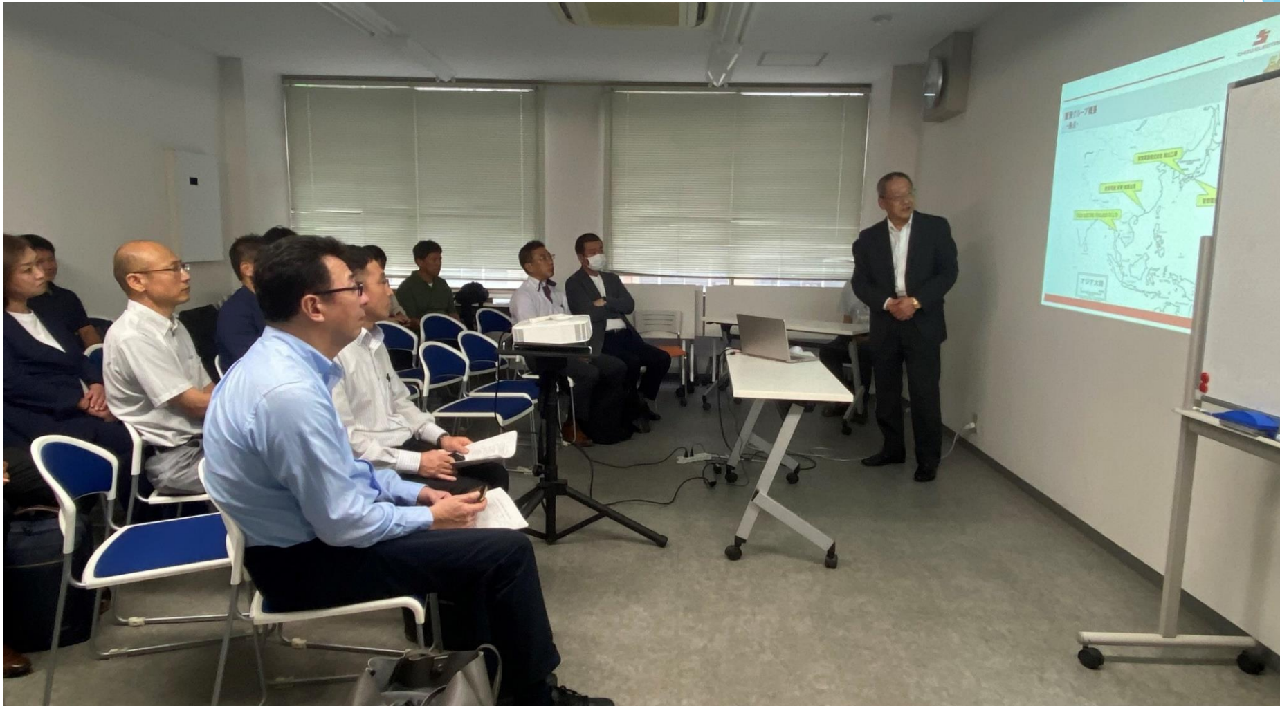
智頭電機(株)白藤様の講演の様子①