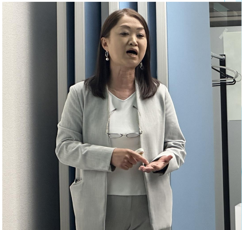
(株)ティエラ藤井様より企業紹介。市内の企業さんと一体になり、自社製品の「エルビーノ」を“部品からすべて門真のもので作りたい!”と門真製エルビーノ完成に向けて、各社へ協力の呼びかけがありました。