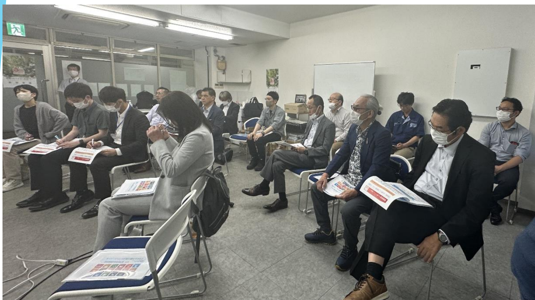
阿南副会長より、町内会活動について、Cグループの現状と今後の動きの方針についてお話がありました。